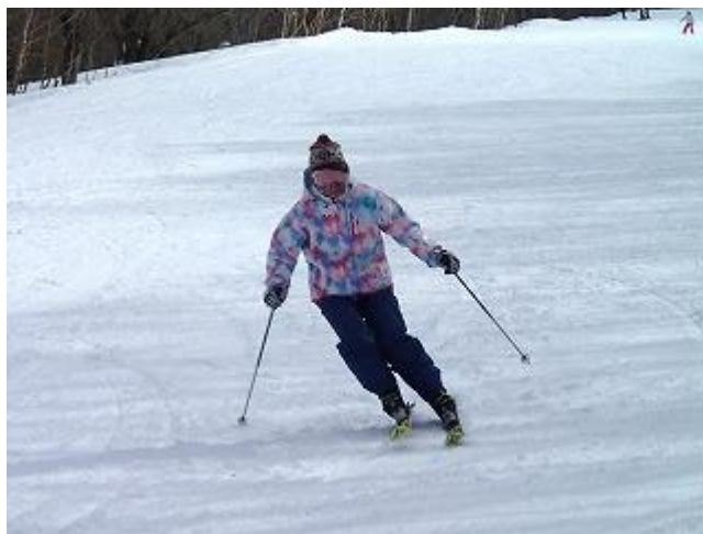
久々のタムタム ママさんウェアでカービング