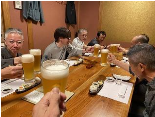
ここの料理は最高です。