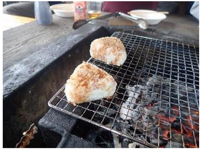
焼きおにぎりも美味しかった。