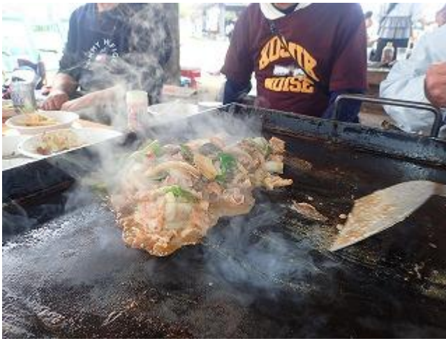
石山君が持ってくるホルモンは最高！