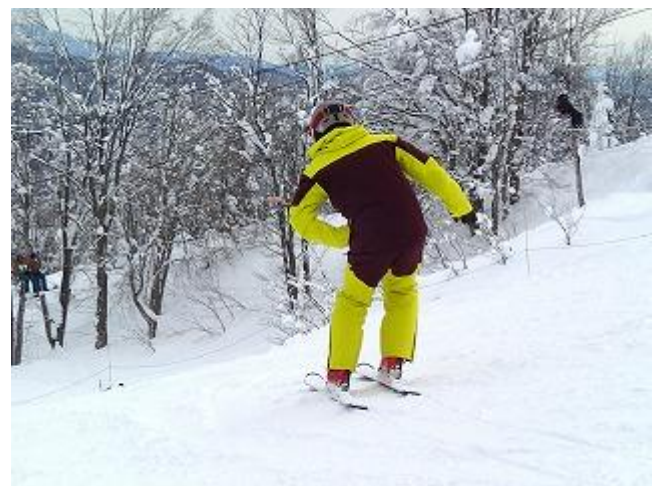
課題の切り替えを練習。