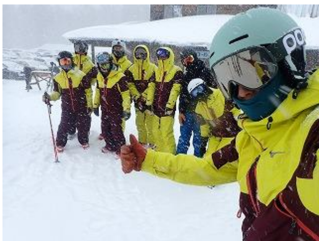
大雪の中でのスキースタート。