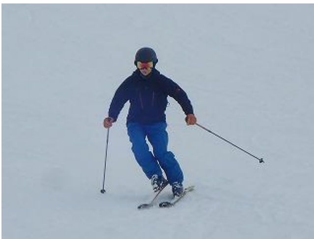
いいポジションに乗れてきた。