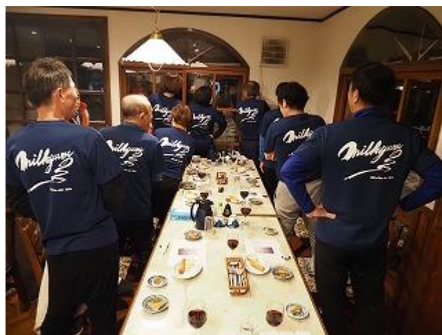
参加者全員で 30 周年記念 T シャツを着用。