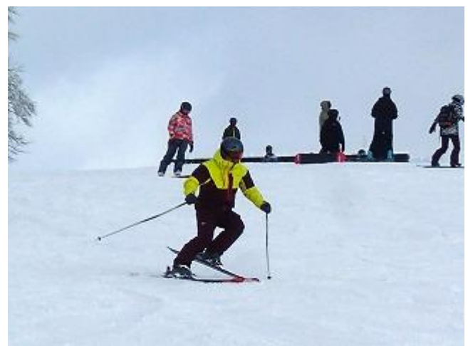
内生蔵君も久々にしっかり基礎練習。