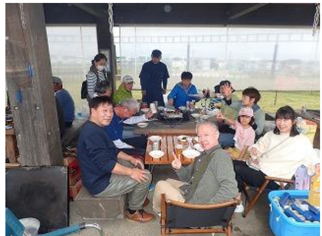
田畑君も久々に参加。