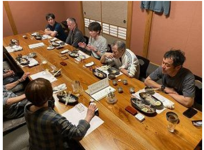
美味しい日本酒に酔いしれました。